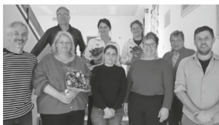
Ralph Waldo Emerson