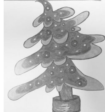
Der unperfekte Weihnachtsbaum

zur Ruhe zu kommen - es war ein fast meditativ Moment, eine kleine Auszeit und ein wunderschöner Gottesdienst.