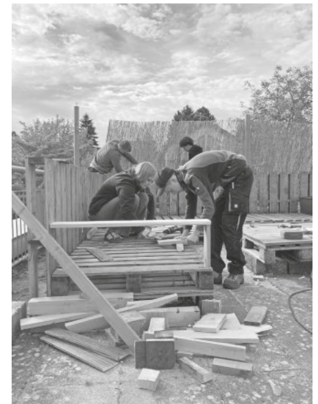
Ralph Waldo Emerson

Mach das Beste aus dir! Etwas Besseres kannst du nicht tun.