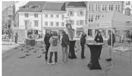
Weltfrauentag 2025 auf dem Marktplatz in Lörrach: Getötet aufgrund des weiblichen Geschlechts – die Kunstaktion „Blutrote Schuhe“ macht jährlich jeden einzelnen Femizid in Deutschland sichtbar.

unbezahlten Sorgearbeit, sind in politischen Entscheidungsprozessen unterrepräsentiert, verdienen im Durchschnitt weniger als Männer und sind häufiger von partnerschaftlicher Gewalt betroffen. Der Tag steht für Solidarität, gegenseitige Unterstützung und das Ermutigen, Rechte einzufordern.