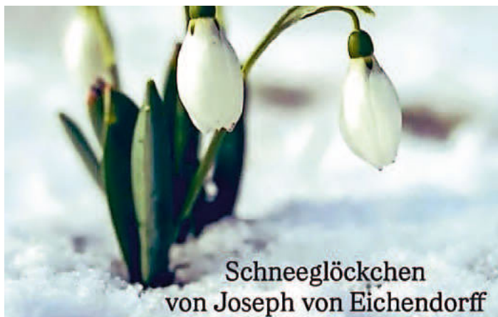
Schneeglöckchen von Joseph von Eichendorff

S' war doch wie ein leises Singen In dem Garten heute Nacht, Wie wenn laue Lüfte gingen: Süße Glöcklein, nun erwacht, Denn die warme Zeit wir bringen, Eh's noch jemand hat gedacht. S' war kein Singen, 's war ein Küssen, Rührt' die stillen Glöcklein sacht, Dass sie alle tönen müssen Von der künft'gen bunten Pracht.