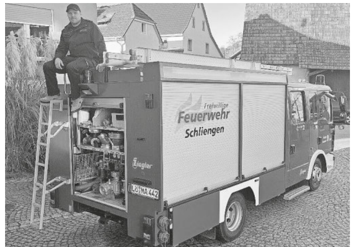
Euch allen allzeit ein Gut Wehr!