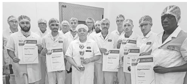
Das Produktionsteam der Metzgerei Dosenbach freut sich über den Goldregen und den Pokal.

Bei der Qualitätsprüfung „Meisterstücke Mettwurst-Pokal“ werden Betriebe des Fleischerhandwerks ausgezeichnet, die sich in besonderem Maße bei der Pflege der handwerklichen Fleisch- und Wurstkultur hervorheben und regionale Vielfalt erlebbar machen. Die Metzgerei Dosenbach wurde dabei bei der diesjährigen Prüfung prämiert.