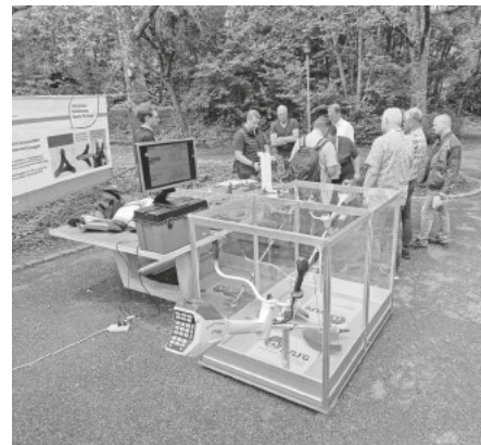
Ein Simulationsgerät vermittelt Vibrationen praxisnah.

Weitere Infos, Muster-Gefährdungsbeurteilungen und aktuelle Präventionsbroschüren stehen zum Download auf der Internetseite www.svlfg.de/waldarbeit bereit.