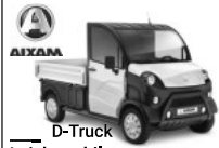
D-Truck Leichtmobile Tullastraße 6 79341 Kenzingen