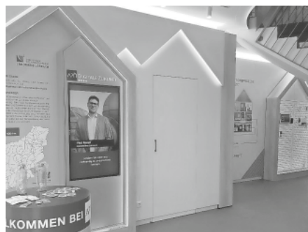
Bildunterschrift: das neue GLASFASER-ZENTRUM in Lörrach

Der Glasfaserausbau in allen Ortsteilen der Gemeinde Schliengen begann im Jahr 2021 wird gefördert durch das Land Baden-Württemberg.