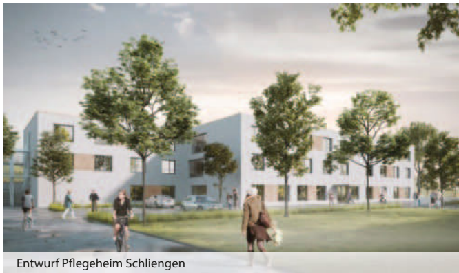
Entwurf Pflegeheim Schliengen