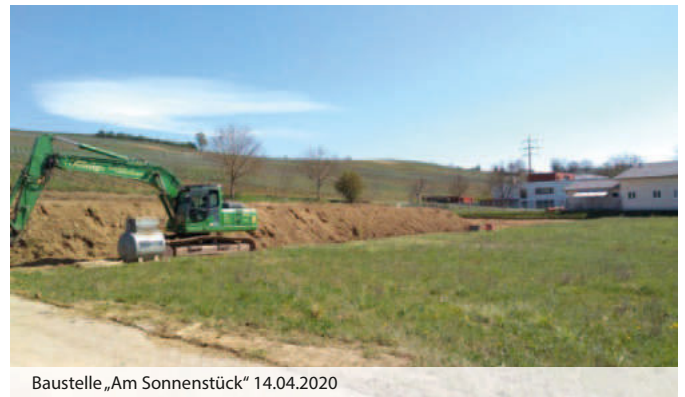
Baustelle „Am Sonnenstück“ 14.04.2020