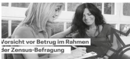
Vorsicht vor Betrug im Rahmen der Zensus-Befragung

Warnung vor Betrügern bei der Zensusbefragung