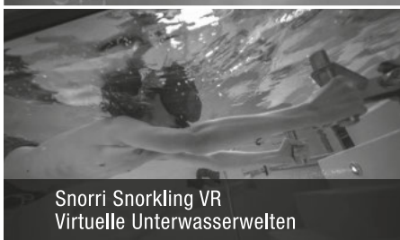
Snorri Snorkling VR Virtuelle Unterwasserwelten