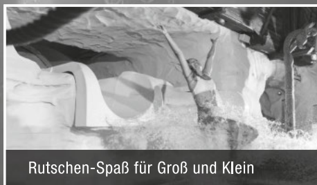
Rutschen-Spaß für Groß und Klein