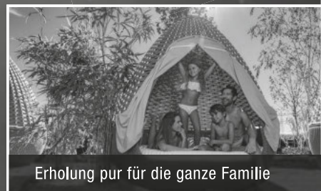
Erholung pur für die ganze Familie