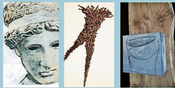
11. 11. 2018 - 8. 2. 2019 Wasserschloss Entenstein, Schliengen

Die Kunschtchaffenden des Schliengener Kunstforums zeigen neue Werke und freuen sich auf Ihr Kommen: